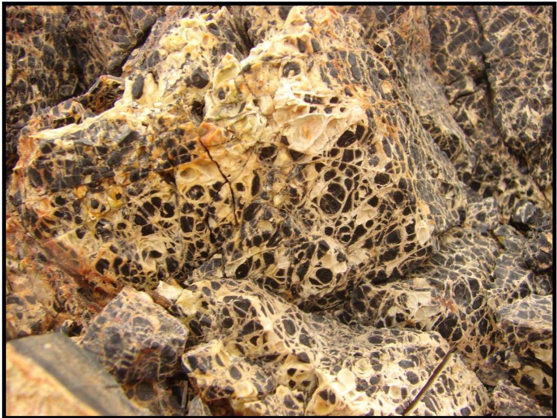
Obsidienne très fissurée avec opale jaune, entre Ali Sabieh et Guéfileh