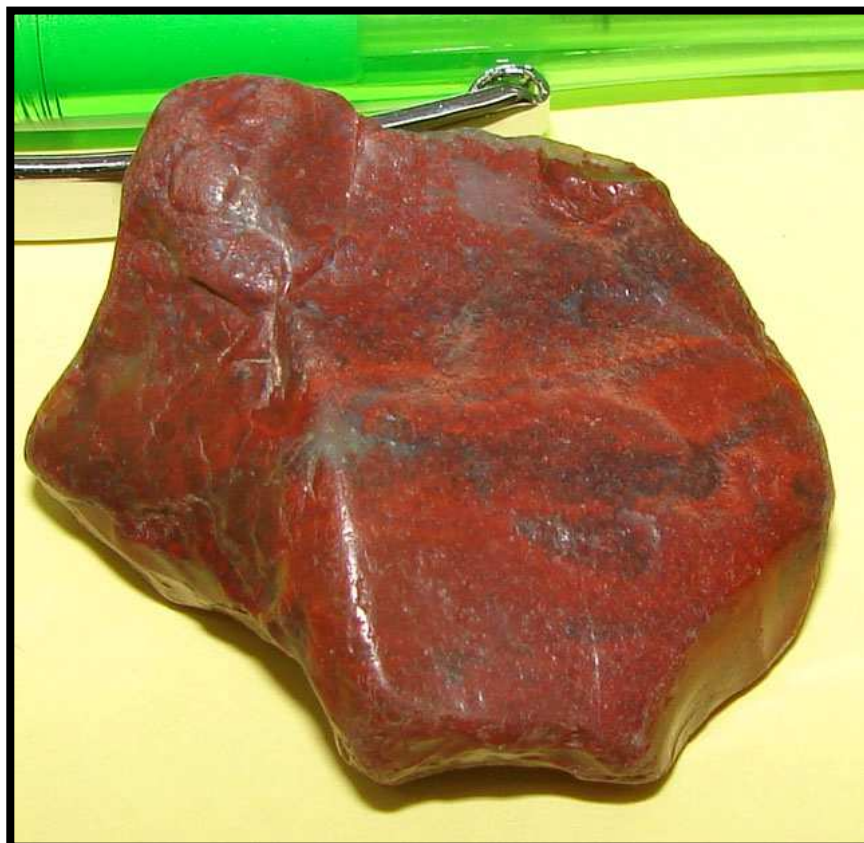
Jaspe rouge - Plaine de Hanle