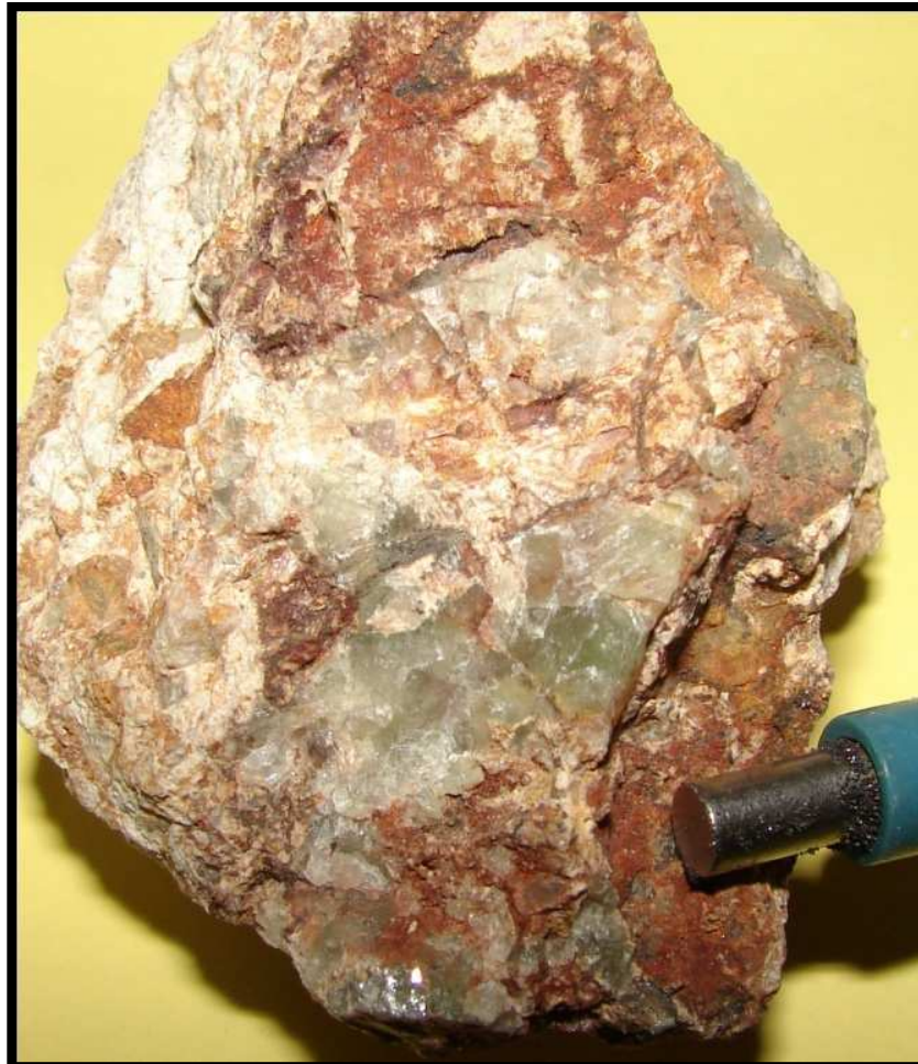
Cristaux de fluorine (Mont Boura)