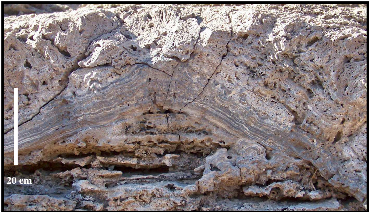
Travertin carbonaté stromatolithique, plaine de Hanle