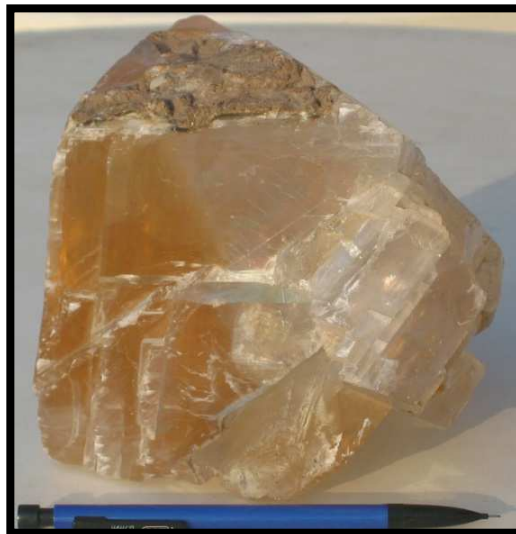
Veine de Spath d'Islande (région Tadjourah)