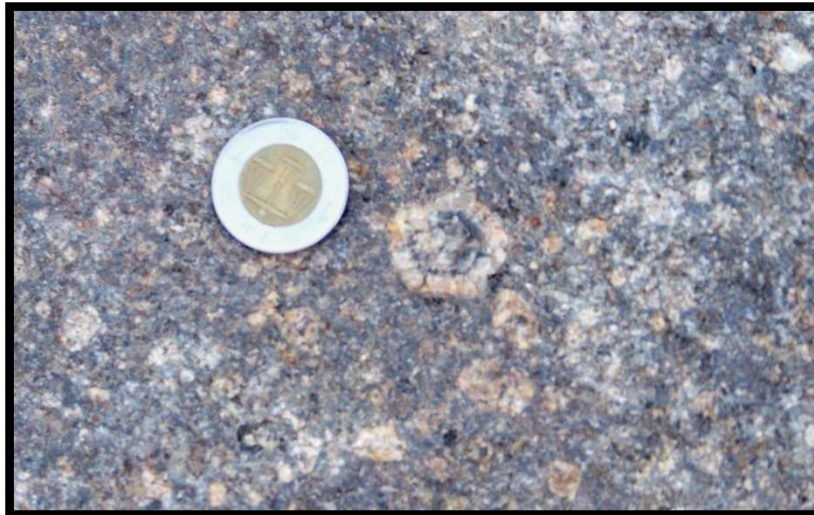
Olivine (secteur de Gour'obbous : basalte de la série stratoïde Afar - série moyenne