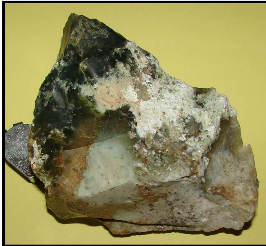
Jaspe (calcédoine verte), oued Kalou, formation sédimentaire et volcano-sédimentaire Mio-Pliocène (d'après Boucarut et al. , 1974).