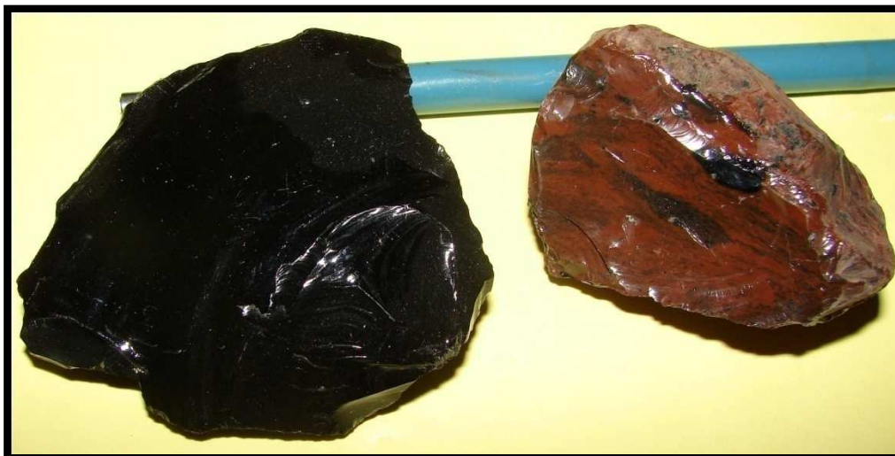
Obsidienne noire et chocolat avec des inclusions d'obsidiennes noires