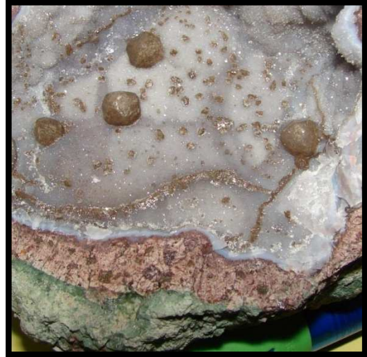
1 : Géode avec fine couche de calcédoine, de cristaux de quartz et un beau cristal de sidérite (flèche : carbonate de fer), secteur Lac Asal.